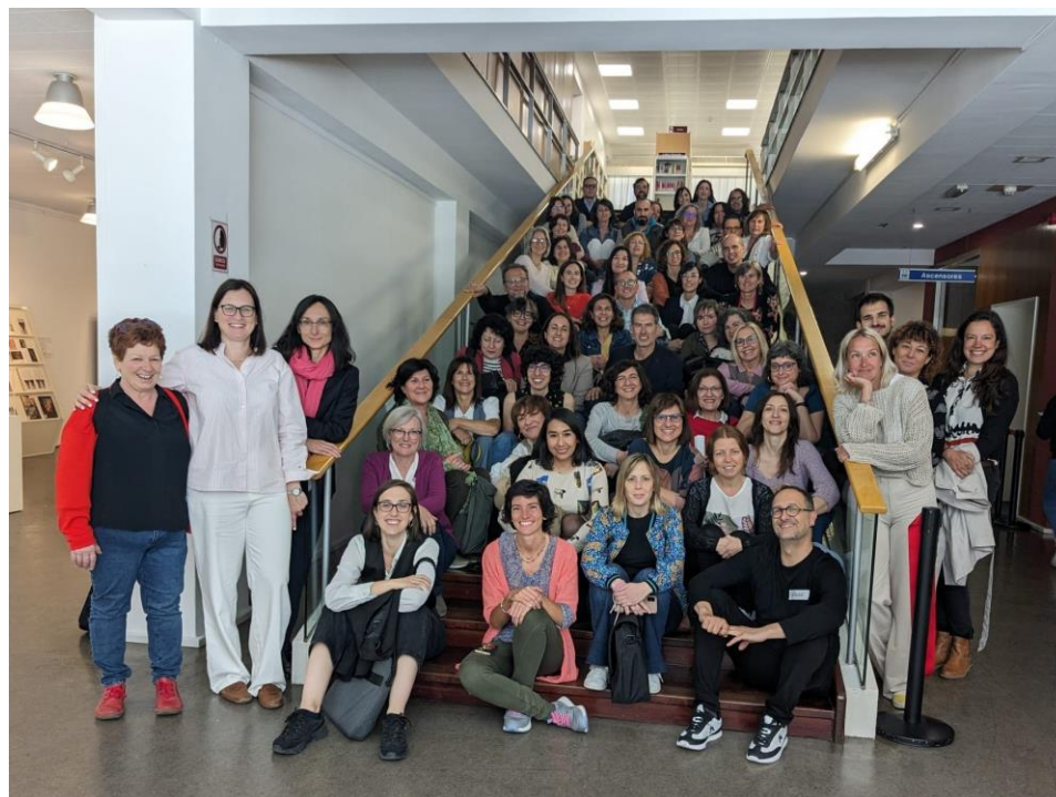
Participantes en la Jornada de Laboratorios Bibliotecarios. Zaragoza. Mayo, 2023.

Todo este trabajo ha sido recogido en una publicación que se presentó hace dos meses en Madrid. Esta guía incluye textos de profesionales del ámbito bibliotecario, acceso a 6 vídeos conversatorios entre profesionales de las bibliotecas con profesionales de la innovación social, los prototipos resultado del taller de Laboratorios Bibliotecarios celebrado en Zaragoza, y un toolkit (caja de herramientas) con 18 metodologías prácticas para pasar a la acción. Este libro , disponible en abierto en la web de Laboratorios Bibliotecarios, también da acceso a dos herramientas de diagnóstico online para que el personal bibliotecario pueda hacer una radiografía del estado de su biblioteca con consejos para poder avanzar en cada uno de los vectores.