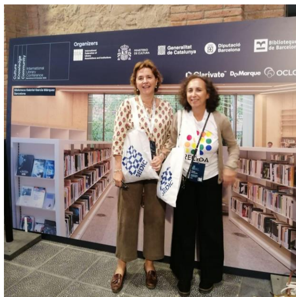
Figura 8: Autoras del artículo en los Encuentros Internacionales.

El evento concluyó con reflexiones inspiradoras sobre el futuro de las bibliotecas de arte, destacando la relevancia de la colaboración internacional y la adopción de tecnologías avanzadas para optimizar el acceso y la conservación del patrimonio cultural.