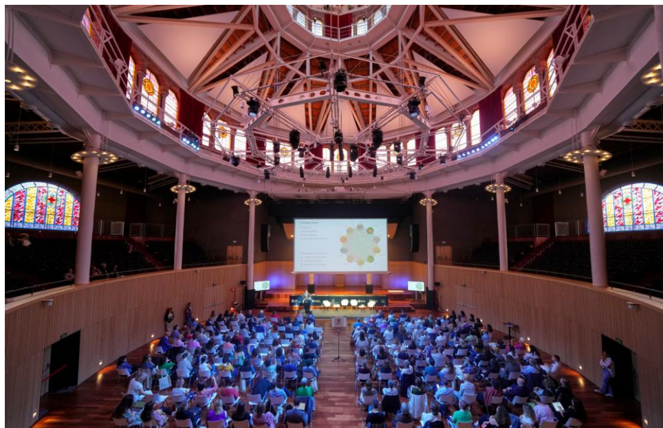
Figura 3: Paraninfo de la Escuela Industrial de Barcelona.

En la mesa sobre la democracia se ha debatido cómo las bibliotecas generan participación ciudadana y abordan asuntos conflictivos o controvertidos. Se ha hecho hincapié en que se debe argumentar mejor a los políticos la labor que se realiza y así visualizar más el trabajo y poder avanzar.