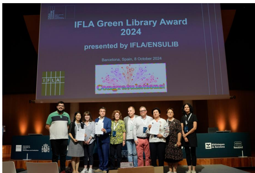
Figura 5. Entrega de premios a la Mejor Biblioteca / Proyecto Verde.

También se ha ocupado, como hemos comentado anteriormente, de organizar la entrega del premio a la Mejor Biblioteca Verde y al Mejor Proyecto Verde.