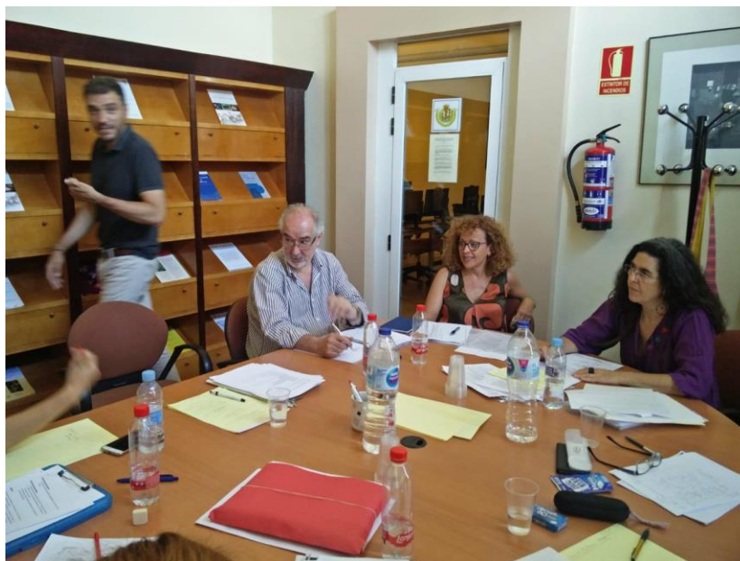
Largos debates y consensos del Grupo de Trabajo #BiblioRRHH

De esta forma podemos explicar cómo desarrollamos nuestro trabajo en cuatro fases: