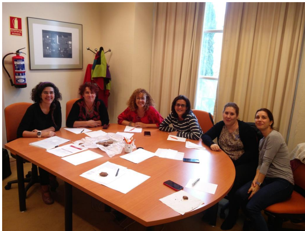
Primeras reuniones del grupo #RRHH en el Ilustre Colegio Oficial de Médicos de Madrid

Allá por junio de 2017, en una de nuestras reuniones de trabajo de BiblioMadSalud cuyo tema era el reconocimiento de nuestra profesión, el grupo de trabajo conformado por 15 representantes de bibliotecas de ciencias de la salud de diferentes ámbitos, identificamos como problema principal de nuestra profesión no tener bien definida la figura del bibliotecario/documentalista de ciencias de la salud. Esta carencia dificultaba, entre otras cuestiones, la convocatoria de oposiciones con perfiles adecuados a las verdaderas competencias de nuestra profesión y, por tanto, con las habilidades, los conocimientos y el dominio de las herramientas requeridas para ofrecer servicios profesionales completos y de alta calidad.