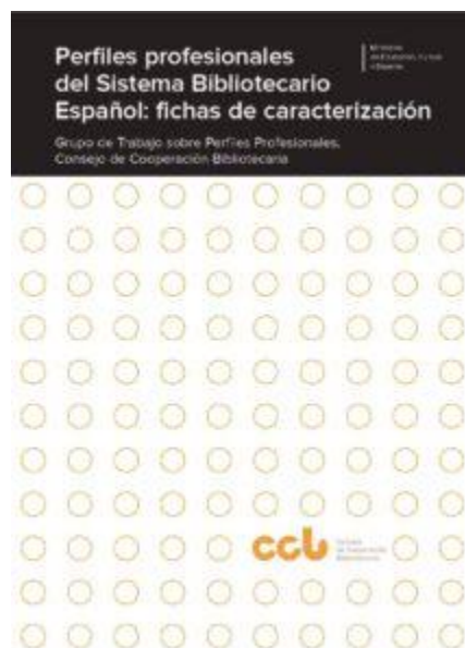
Perfil 22 Bibliotecario/Documentalista en Ciencias de la Salud, pag.51-3.

Nuestro perfil fue validado en abril de 2019 por el Grupo de Trabajo sobre Perfiles Profesionales del Consejo de Cooperación Bibliotecaria.