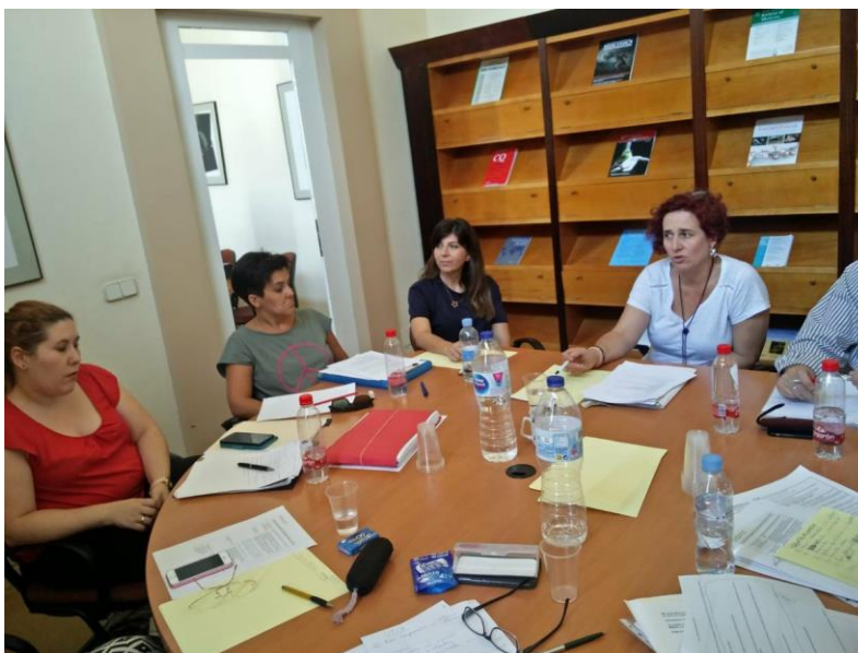
Reuniones grupo #BiblioRRHH de BiblioMadSalud

Creamos un grupo de trabajo (GT) en febrero de 2018 al que denominamos #BiblioRRHH en el seno de BiblioMadSalud , por entonces colectivo de profesionales de bibliotecas de ciencias de la salud que desde 2016, como organización asamblearia, nos reuníamos periódicamente y organizábamos una jornada anual.