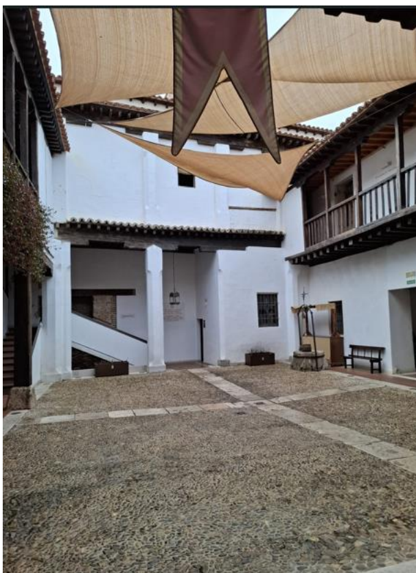
Figura 5. Patio interior del Hospital

Si nos referimos al espacio que ocupa El Hospital de Nuestra Señora de la Misericordia, conocido popularmente como Hospital de Antezana o el Hospitalillo, es uno de los edificios más emblemáticos de Alcalá de Henares por su valor histórico, arquitectónico y urbano. Situado en el número 46 de la Calle Mayor, en el corazón del casco histórico —junto a la Casa Natal de Cervantes—, su conservación y restauración han sido consideradas de interés patrimonial para la ciudad tanto por su antigüedad como por su función social continuada desde 1483 4 .