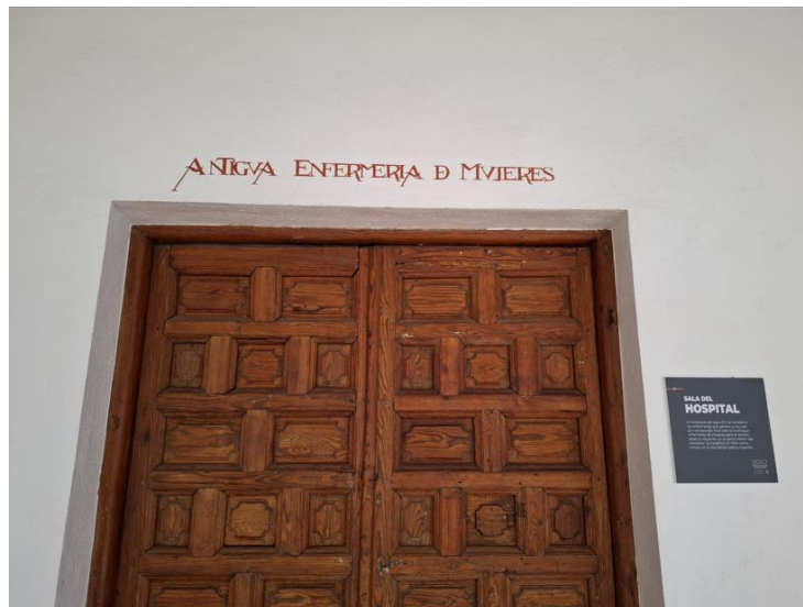
Figura 4. Entrada al Museo

El Museo de la Medicina del Siglo de Oro de la Fundación Antezana ofrece una mirada única sobre cómo se practicaba y enseñaba la medicina en la España del Renacimiento. A través de una cuidadosa musealización del conjunto hospitalario, combina espacio, objeto, documento y narrativa para trasladar al visitante a la experiencia médica de hace más de cuatro siglos, promoviendo la reflexión sobre la historia sanitaria, el papel social de la medicina y la memoria institucional.