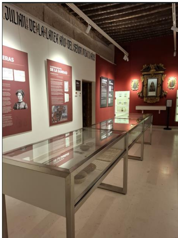
Figura 3. Museo de la Fundación

La musealización busca ofrecer una experiencia inmersiva y educativa, permitiendo a los visitantes comprender las prácticas médicas, sociales y asistenciales de la época, así como su marco humanista y su relación con la enseñanza universitaria.