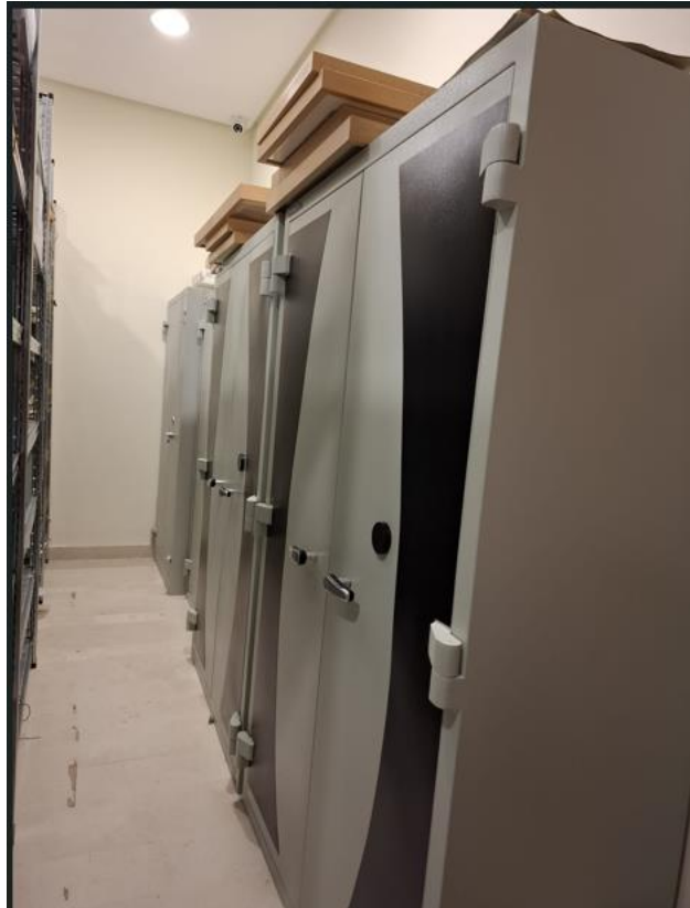
Figura 2. Depósito del Archivo