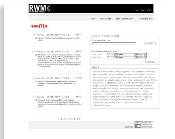
Figura 1: Ràdio Web MACBA en 2006.

Aunque empezó con una única línea de programación, en su origen Ràdio Web MACBA ya tenía visión de escalar hacia una parrilla de programación radiofónica más amplia. Creamos un dominio a parte porque queríamos significar que se trataba de un espacio más del Museo, con programación propia. El primer programa fue el Son[i]a , línea que a fecha de hoy sigue publicándose y que cuenta ya con 340 programas. En la etapa de lanzamiento publicamos dos o tres cápsulas cada semana de unos 10-12 minutos cada una. Con los recursos disponibles, este ritmo fue sostenible solo durante unos pocos meses. Pero las estadísticas pronto demostraron que había interés por parte de la audiencia, lo que nos animó a continuar. Además, el formato encajaba en nuestras expectativas y nos permitía crear nuevas redes de trabajo colaborativo, no solo con otras personas del equipo del museo, sino también con otros agentes de nuestro entorno que se sumaban a enriquecer el proyecto. Nos movíamos continuamente entre el amateurismo y la profesionalización.