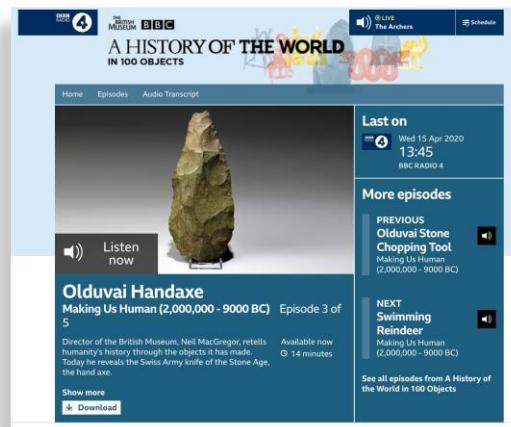
Figura3: Selección del sitio web del pódcast A History of the World in 100 Objects .

En cuanto a las preferencias de este público, lo interesante es que lo más escuchado no son los programas estrella de las radios generalistas (los deportivos y tertulias de gran audiencia en directo), sino de los espacios nicho, como los de divulgación histórica, que son un auténtico fenómeno.