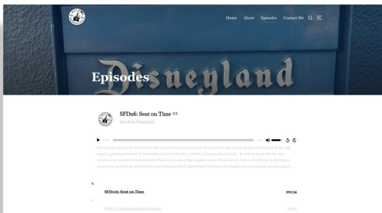
Figura4: Sitio web del pódcast Sent From Disneyland .

Fuera del ámbito institucional, quiero destacar un proyecto pequeño, particular y maravilloso que es un ejemplo singular de activación de una colección a través de la narrativa sonora. Se trata de Sent From Disneyland , un podcast semanal amateur que reconstruye la historia del parque temático más emblemático del mundo a través de postales de particulares enviadas desde Disneyland. Las postales, originalmente concebidas para el uso privado y el sentido de la vista —se miran y se leen—, adquieren una dimensión nueva al ser activadas por Clocky McDowell, el autor del pódcast. Se trata pues de una lectura con una óptica, visión y conocimiento que se superponen a las características originales del objeto. En Sent From Disneyland no solamente indagamos en la historia del parque, si no que especulamos también sobre las personas que escriben y reciben esas postales.